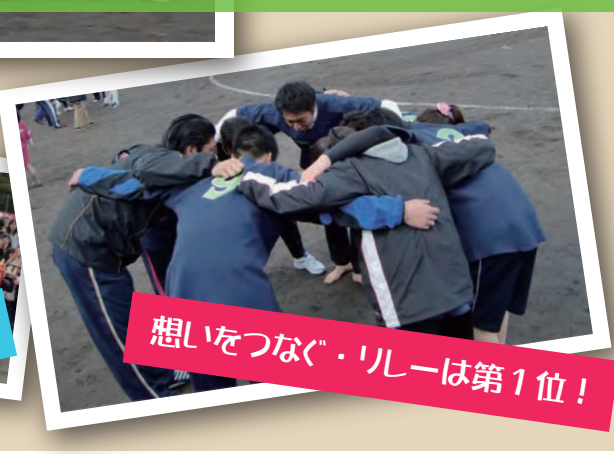
想いをつなぐ・リレーは第1位！