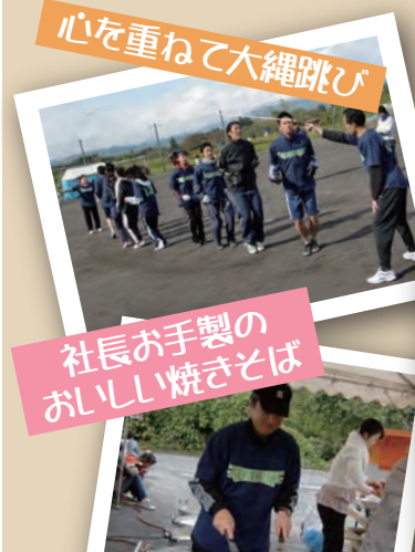
心を重ねて大縄跳び 社長お手製の おいしい焼きそば

しかし、この大運動会への参加はメンバーでない社員の協力や応援があってこそで、会社全体のチームワークが強化されたように思います。お葬儀も、お客様と心を重ねて、スタッフのチームワークがあっちはじめてお客様に満足いただけるものです。このチームワークをお客様のため、地域の皆様のために活かしていきます。