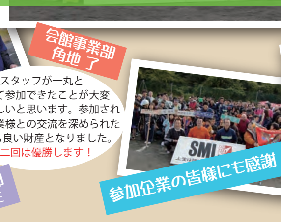
会館事業部 角地了 参加企業の皆様にも感謝