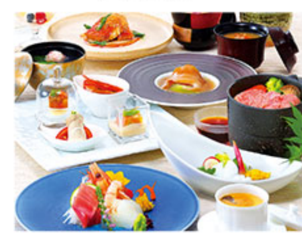
通夜料理 法事料理