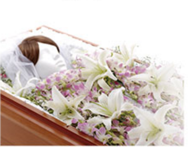
キャスケットフラワー