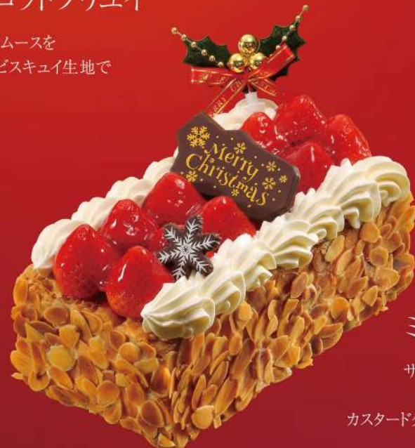
プレミアム ミルフィーユ