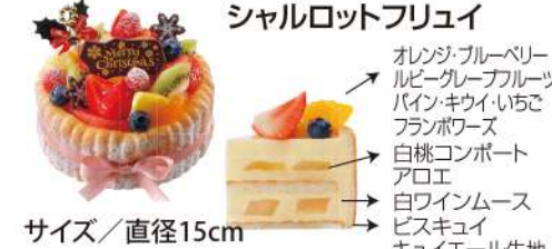
シャルロットフリュイ

オレンジ・ブルーベリー ルビーグレーフルーツ パイン・キウイ・いちご フランボワーズ 白桃コンポート アロエ 白ワインムース ビスキュイ キュイエル生地