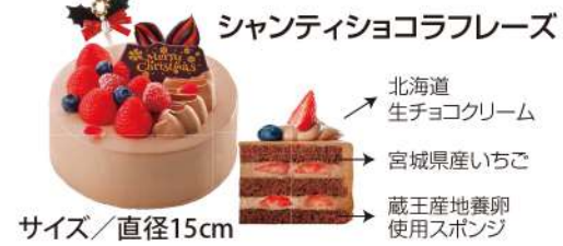
シャンティショコラフリーズ