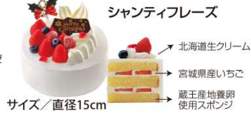
シャンティフリーズ