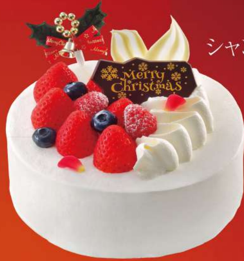
シャンティフリーズ