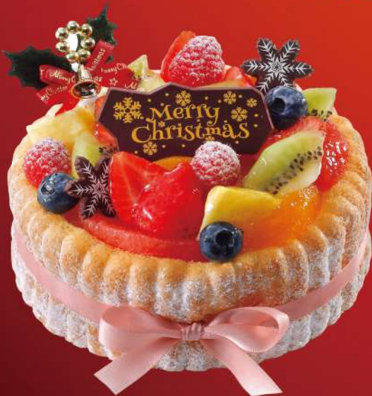
シャルロットフリュイ