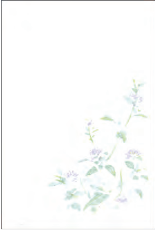
No. A インクジェット対応